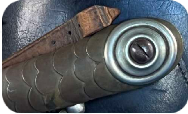
Bild 4: Gewölbte Schuppenkette mit Befestigung eines M/60 (Sammlung SMH)