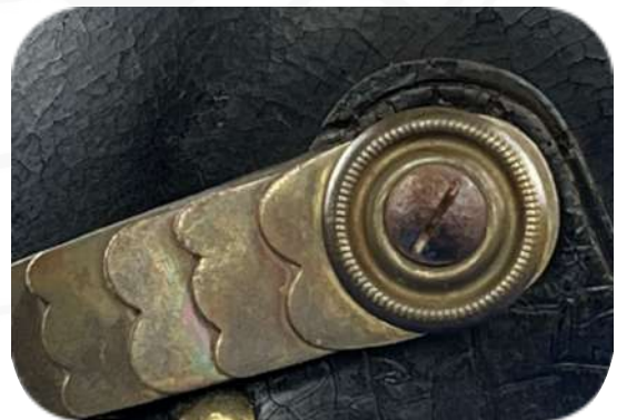
Bild 2: Flache Schuppenkette mit Befestigung eines M/71 (Sammlung SMH)

☛ Mit dem per AKO vom 3. November 1860 eingeführten Helm M/60 wurden dann auch die gewölbten Schuppenketten etwas schmaler, in den Maßen ähnlich wie die flachen Schuppenketten.