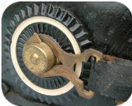
Bild 8: Kinnriemenbefestigung M/91