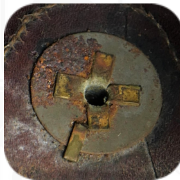
Bild 9: Beispiel einer M/91-Rosettenbefestigung von Innen, mit einem Stift als Verdrehsicherung