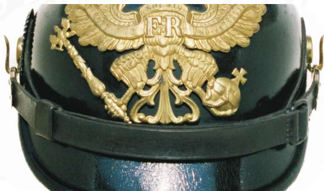
Bild 6: Kinnriemen eines M/87