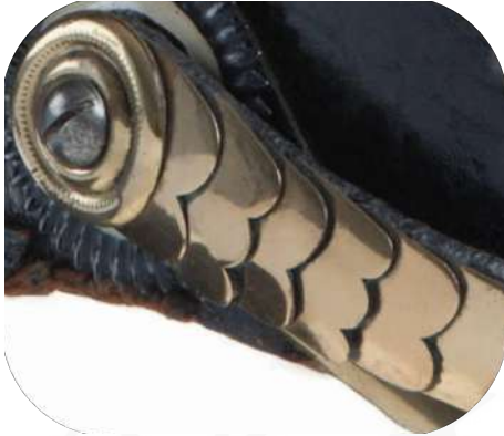
Bild 3: Gewölbte Schuppenkette mit Befestigung eines M/71 der FAR