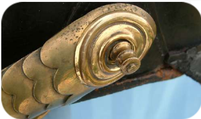
Bild 1: Schuppenkettenbefestigung M/42