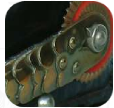
Bild 10: Gewölbte Schuppenkette mit M/91-Rosette

• Wie schon 1887 wurde der neue Kinnriemen zuerst nur für die Helme der Infanterie eingeführt. Für die Kavallerie, die Artillerie und dem Train wurde diese Kinnriemenbefestigung erst mit der AKO vom 18. Mai 1894 allgemein übernommen.