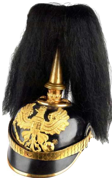
Abb. 7: Offiziershelm mit Paradebusch (aus privater Sammlung)

Gutachten der Garde du Corps bestätigt, welches zu dem Versuchshelm der Firma W. Jäger im Jahr 1841 erstellt wurde (SIEHE NOCHMAL DIE ABSCHRIFTEN ABB. 4 + ABB. 5). Die restlichen der von mir aufgezählten gewünschten Eigenschaften eines Soldaten-Helmes stammen aus Aufsätzen in Fachzeitschriften der damaligen Zeit. 5