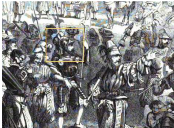
Abb. 1: Landsknechte bei der Musterung - Die illustrierte Welt. Blätter aus Natur u. Leben, Wissenschaft u. Kunst zur Unterhaltung u. Belehrung für die Familie, für Alle und Jeden - Bd 13

Für den 1842 in der preussischen Armee eingeführten Helm setzte sich in Deutschland sehr schnell die volkstümliche Bezeichnung „Pickelhaube“ durch. Schon Monate vor dessen Einführung, bereits in einem Artikel vom 22. Juli 1841, wurde der Vergleich zur mittelalterlichen Pickelhaube angestellt und damit der Name geprägt. So schreibt die Allgemeine Militär-Zeitung Nr. 63/1841 über die neue Helm-Form: „Sie sind den Pickelhauben aus den Ritterzeiten ähnlich.“; und weiter: „Eigenthümlich ist diesen neuen Helmen bei der Form derer des Mittelalters, daß sie oben auf der Mitte eine kegelförmige Spitze haben...“ 1 In späteren Zeitungsartikeln wurde das Aussehen der Pickelhaube zudem auch mit den „mittelalterlichen Kopfbedeckung der Fussknechte“ oder mit den „Sturmhauben deutscher Landsknechte“ verglichen. Hervorzuheben ist dabei der Umstand, dass der Wortteil „Pickel“ sich nicht direkt auf die Spitze des Helmes bezieht, sondern der Begriff „Pickelhaube“ eine Mundart der Bezeichnung „Beckenhaube“ war.