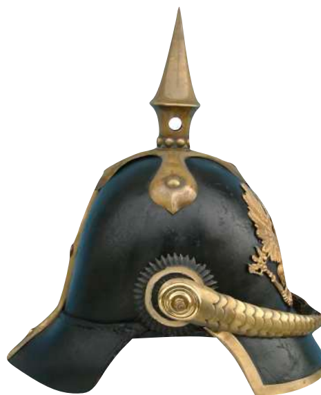
Abb. 2 - Pickelhaube M42 aus privater Sammlung

Das stattliche Erscheinungsbild eines Soldaten hatte zur damaligen Zeit mehr Gewicht als Heute, daher wurde das Thema auch in fast allen Zeitungsberichten, die ich für diesen Artikel recherchiert habe, angerissen. Allgemein war die Meinung über ihr Aussehen Anfangs noch gespalten 2 , später wurde die Pickelhaube jedoch als zweckmäßig und kleidsam erachtet. 3 Die Soldaten und Militärs weltweit lernten die Vorteile des Helmes schnell zu schätzen, und so wurde er nach und nach in vielen Armeen der Welt eingeführt. 4